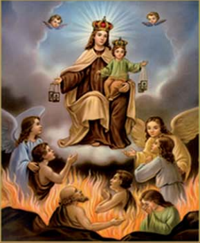
Our Lady of Mount Carmel