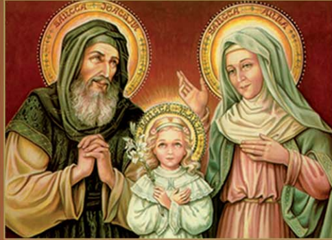
St. Anne & Joachim