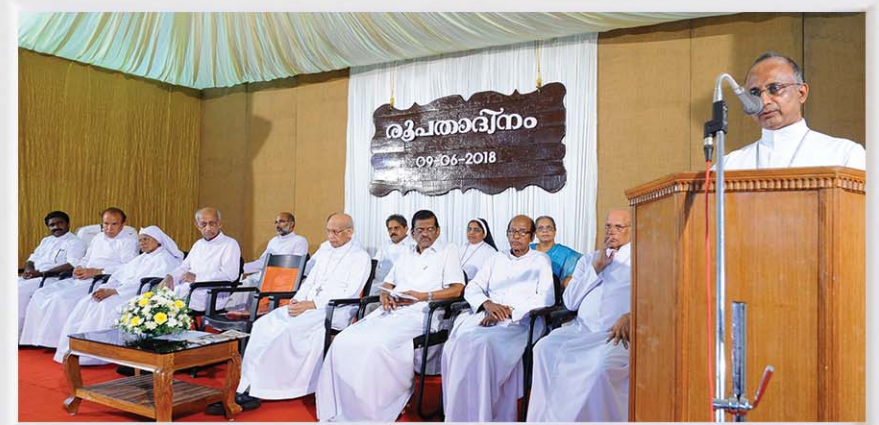
രൂപതാ ദിനം 09.06.2018