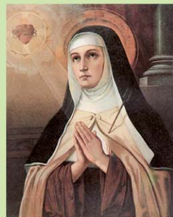
St. Theresa of Avila