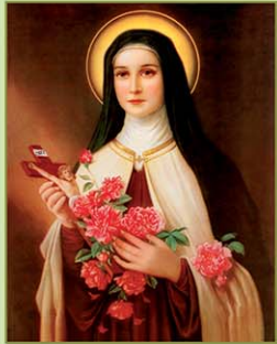
St. Little Flower