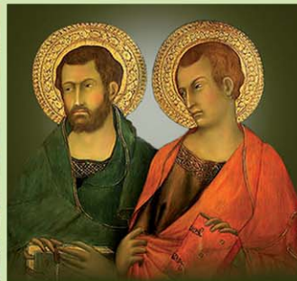
Sts. Simon & Jude