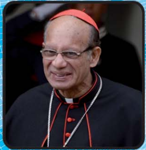
PRESIDENT HIS EMINENCE OSWALD CARDINAL GRACIAS Archbishop of Bombay