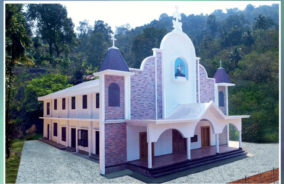
2018 ഫെബ്രുവരി 11-ാം തീയതി കൂദാശ ചെയ്ത പെരിങ്ങാശ്ശേരി സെന്റ് ജോർജ്ജ് ദൈവാലയം.