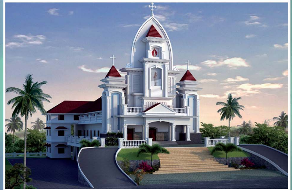
2018 ജനുവരി 30-ാം തീയതി കൂദാശ ചെയ്ത മാതിരപ്പിള്ളി സെന്റ് സെബാസ്റ്റ്യൻസ് ദൈവാലയം.